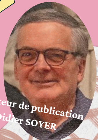
Directeur de publication Didier SOYER

SIRET : 51842667100013 - RNA : W802000257